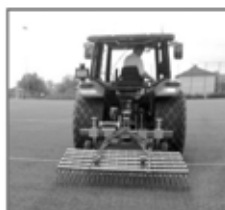
Verti - Rake