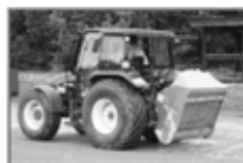
Pískovač Easy Spread

Odborná údržba umělých trávníků. Čištění, dekomprese a doplňování granulátu. Sportovní stavby na klíč.