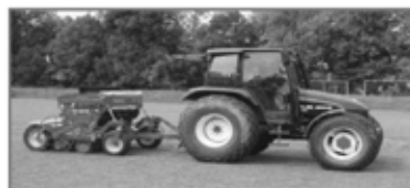
Rapid Turf 200

Zajišťujeme pokládku travních kobereců a realizaci kompletních zavlažovacích systémů.