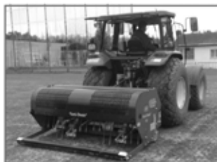
Verti - Drain

Finančně výhodná varianta rekonstrukce!!!!